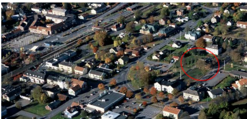
Flygbild med aktuellt område markerat