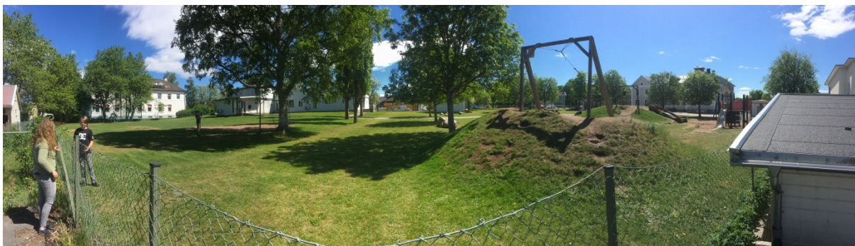
Panoramabild över aktuellt område