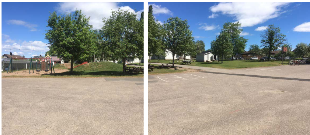
Vy över området

Förslaget är att upphäva gällande tomtindelning för fastigheterna Hjorten 2 och 3. Bakgrund och syftet framgår av beskrivning på sidan 1. Önskad förändring rörande fastighetsbildning kan därmed genomföras.